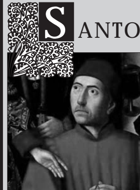
San Eloy (01/12)

1 de Diciembre de 2013 :: Año II · Nº 176