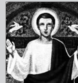
San Mario 19/01/2012

Unas brevísimas notas encontramos de este santo. Nace hacia el año 530, llegando a obispo de Avenicum (en la Suiza actual) en el 574. En el 587 tomó parte activa en el concilio de Macon. En ese mismo año consagró una iglesia dedicada a la Virgen de Payerne. Para mayor seguridad de su persona, lo trasladaron a Avenicum como obispo. Había luchas políticas e inseguridad social. Murió aquí en el año 594. Lo enterraron en la iglesia de san Tirso, pero más tarde se llamó de san Mario.